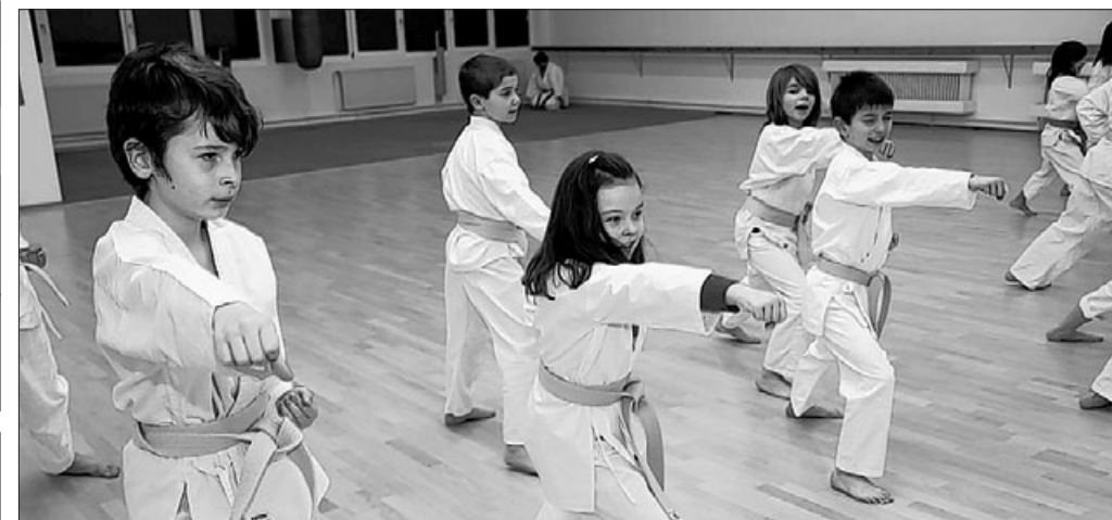
Karate ist eine Sportart für alle Altersgruppen – schon Kinder können teilnehmen.